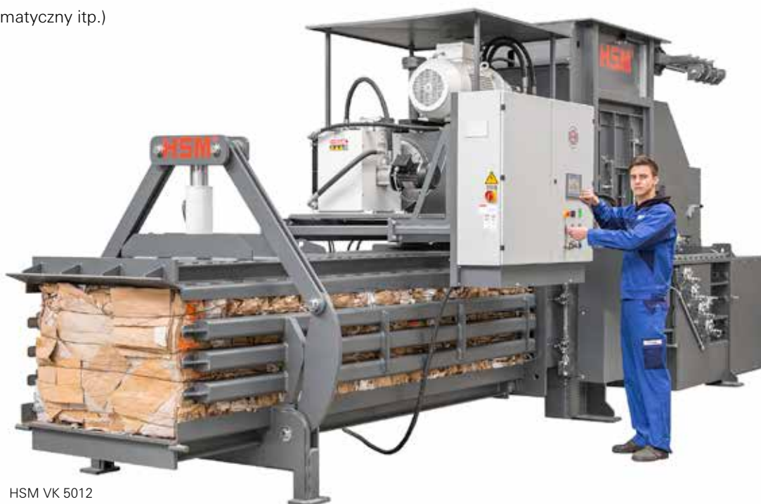
HSM VK 5012

Jesteśmy Państwa partnerem – na każdym etapie życia produktu!