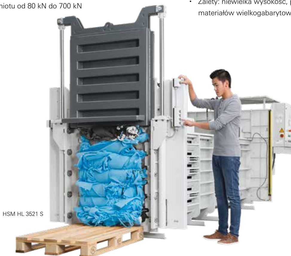
HSM HL 3521 S