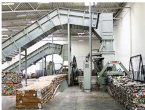
HSM VK 8818