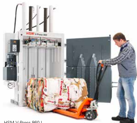
HSM V-Press 860 L