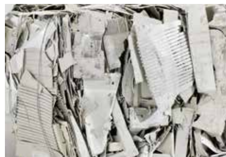
Twarde tworzywa sztuczne

Oprócz papieru, kartonu i folii belownice poziome HSM prasują z powodzeniem silnie rozprężliwe materiały piankowe, styropian, obudowy z twardych tworzyw sztucznych, wiadra blaszane, beczki, opony samochodowe i wiele innych (na zapytanie).