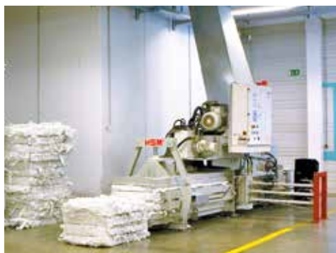
HSM VK 2310