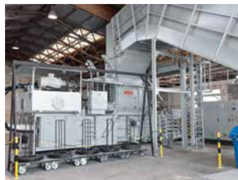
HSM VK 12018